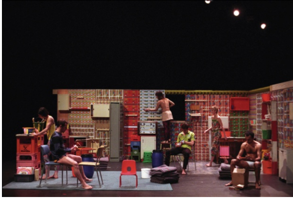
Steack House©Gilles Jobin/photo Isabelle Meister