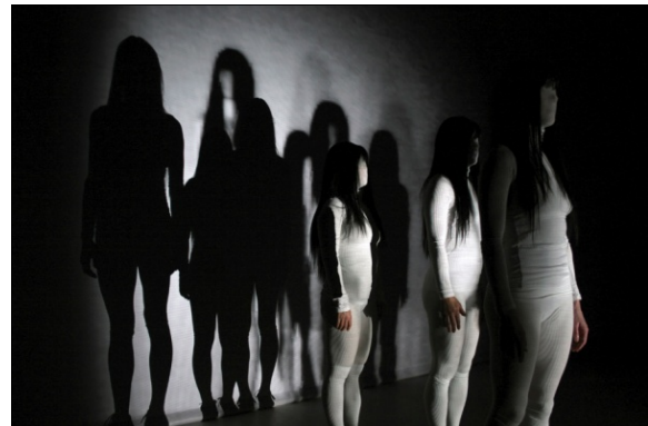
Play back