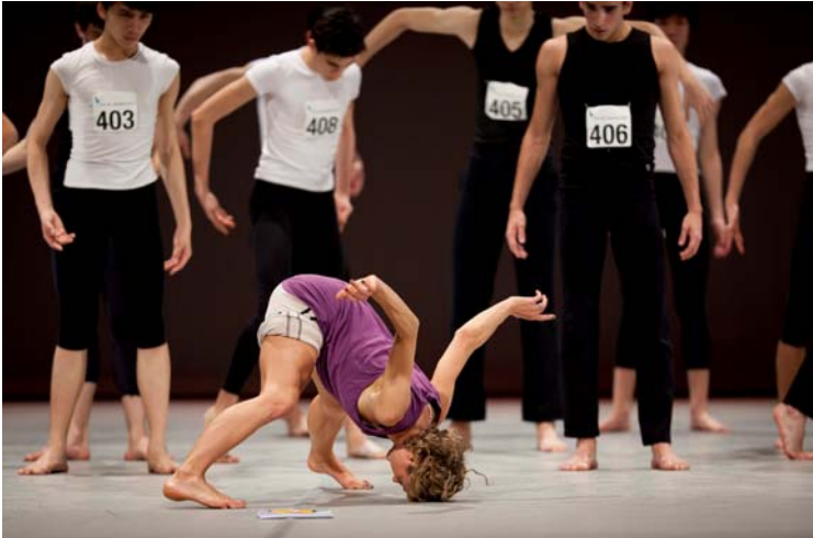
Prix de Lausanne 2012