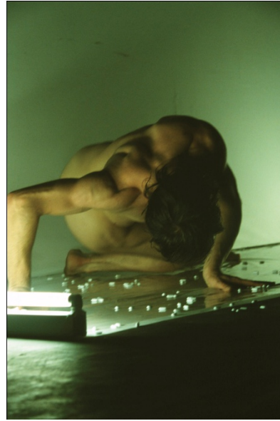
Garçon Clinique©Cie Krassen Krastev/photo Philippe Weissbrodt