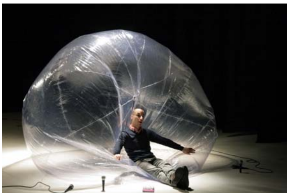
Transitland©Cie Utilité publique