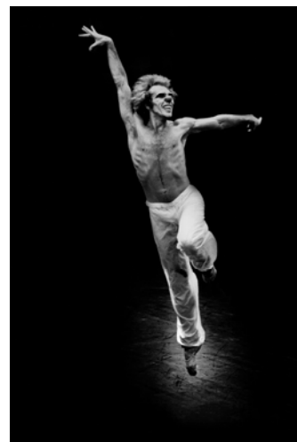
Jorge Donn Vie et mort d'une marionnette humaine