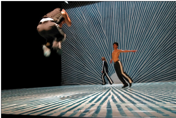
After effects©Cie Arthur Kuggelheyn/photo Jean-Louis Delmotte