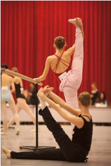
Prix de Lausanne 2011