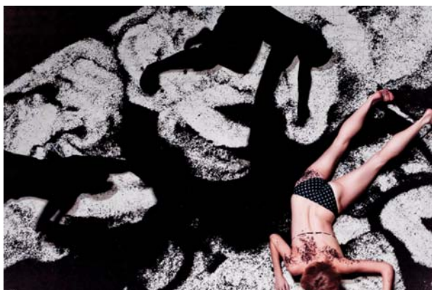
Black Out©Philippe Saire