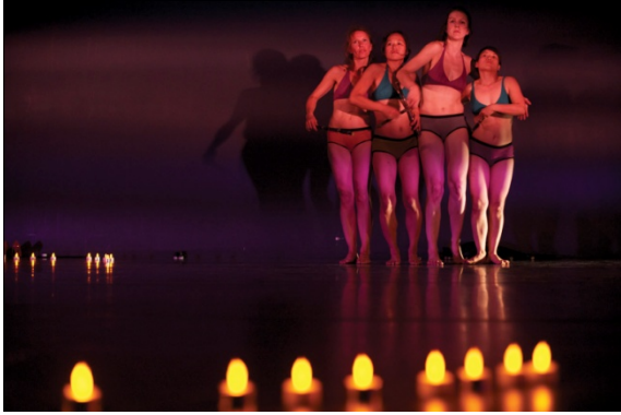
Romanesco©Cie Nuna/photo Samuel Rouge