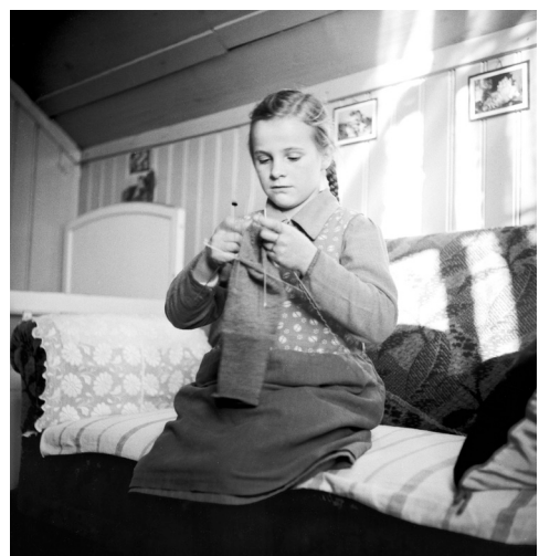
Fillette placée tricotant Canton de Berne, 1946