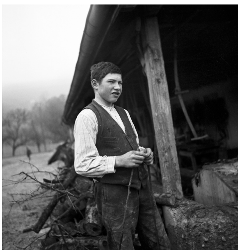
Garçon à la coupe du bois Foyer pour garçons, Oberbipp Canton de Berne, 1940