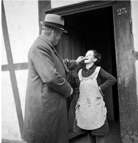
L'inspecteur des pauvres contrôle la dentition d'une fillette placée Canton de Berne, 1940