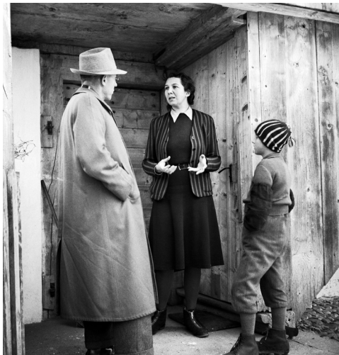
Tuteur commis d'office en visite chez une famille d'accueil Canton de Berne, 1946