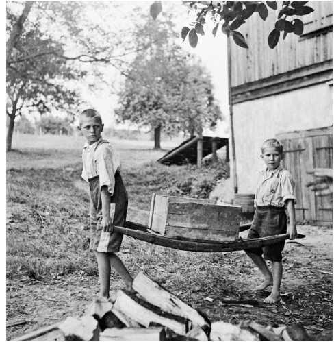
Garçons au travail Établissement de Sonnenberg, Kriens, 1944