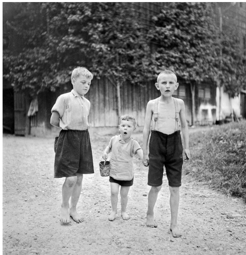
Garçons du foyer de Sonnenberg au travail Kriens, 1944