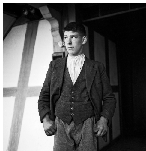
Garçon placé - la visite de l'inspecteur des pauvres Canton de Berne, 1940