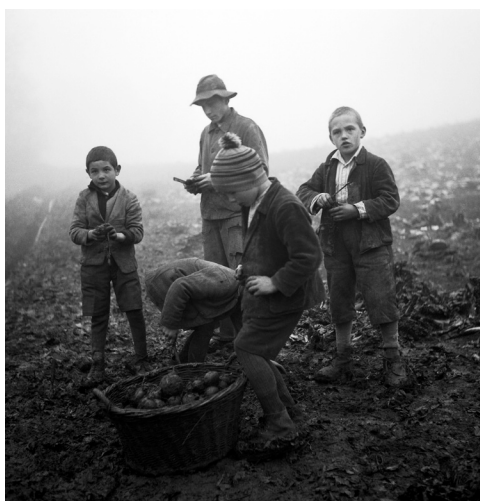
Garçons lors du travail aux champs Foyer d'Oberbipp, Canton de Berne, 1940