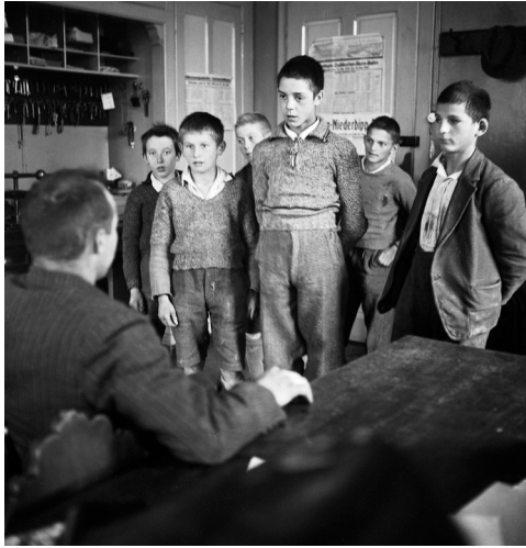
Les garçons et le directeur Foyer pour garçons, Oberbipp Canton de Berne, 1940