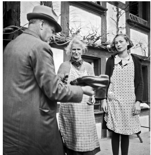
L'inspecteur des pauvres contrôle les souliers d'une jeune fille placée Canton de Berne, 1940