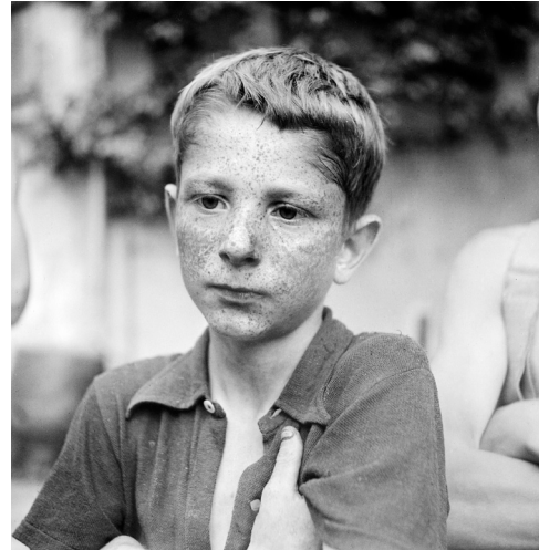
Garçon du foyer du Sonnenberg au travail Kriens, 1944