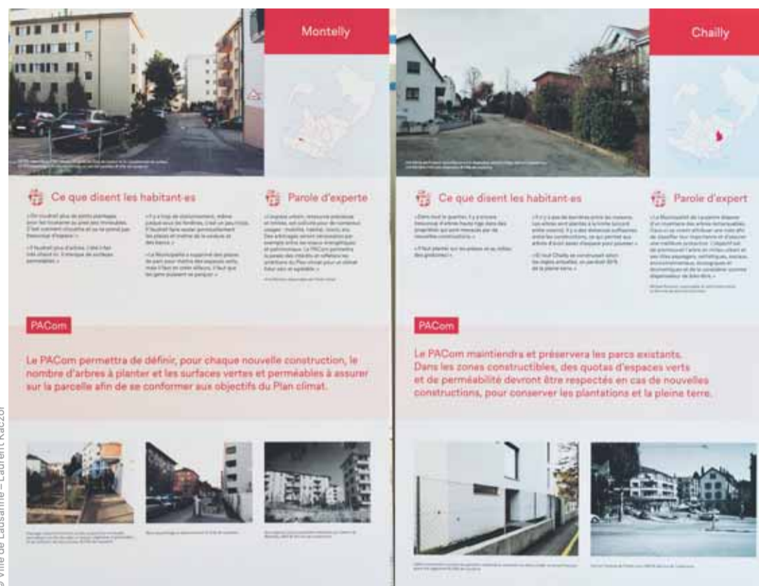
L'exposition montrait des panneaux consacrés aux quartiers et aux avis de la population.

D'autres panneaux illustrent la démarche visant à mieux cerner la richesse et la