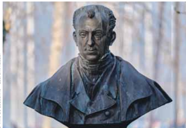
Le buste de Ioannis Capodistrias à Ouchy.

Médecin, humaniste et diplomate grec de haut rang, Ioannis Capodistrias est né à Corfou en 1776, et mort en 1831 à Nauplie, capitale de la Grèce nouvellement indépendante. Il en aura été le premier gouverneur. Envoyé de la Russie en Suisse, à l'heure de l'effondrement de l'empire napoléonien et de la recomposition de l'Europe, Capodistrias fut un promoteur chevronné de l'unité de la Confédération, un artisan minutieux de sa Constitution, un garant de sa neutralité et un défen-