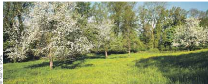
Le verger de la ferme Rosat.

ENVIRONNEMENT — Envisagez-vous de créer un four à pain communautaire, un verger, un rucher, une épicerie participative ou tout autre projet permettant de produire, transformer ou distribuer des produits Bio sur le territoire lausannois? Présentez vite votre idée, la Ville dispose d'un montant de CHF 50'000.- pour financer l'ensemble des projets lauréats. Délai de candidature fixé au 15 juin 2021. | EE