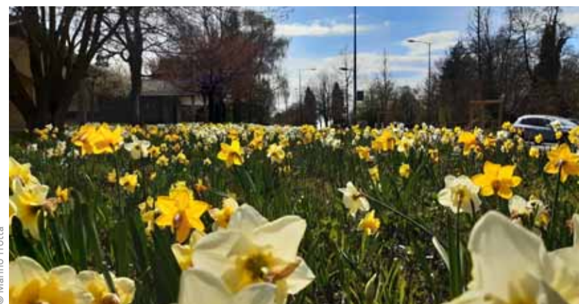
Douze variétés de narcisses auprès du collège de La Sallaz.

Cette démarche illustre l'évolution de la politique de fleurissement