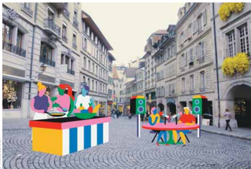
Il reste trois mois pour déposer les projets.

PARTICIPATION — Pour accompagner vos projets dans le cadre du Budget participatif de la Ville, il existe des permanences dont la prochaine aura lieu le 15 juin de 16h à 18h à la bibliothèque de la Sallaz. Nouveauté cette année, chaque foyer lausannois recevra un bulletin de vote dans sa boîte aux lettres.